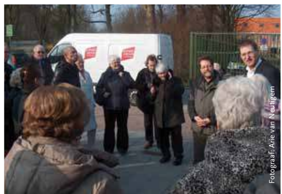
De Energiebus op bezoek bij complex Tuinenhoven in Rotterdam IJsselmonde.