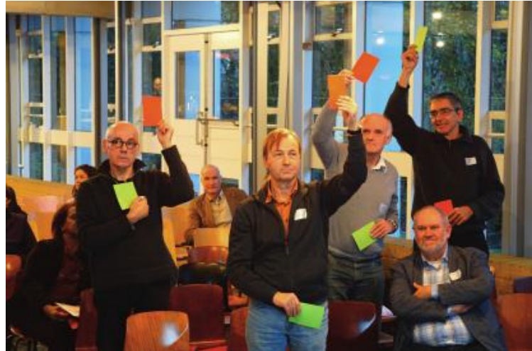
Energiequiz: stemmen voor het goede antwoord met groen of rood briefje