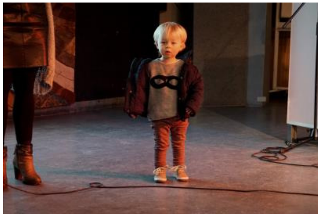
De jongste bewoner.....