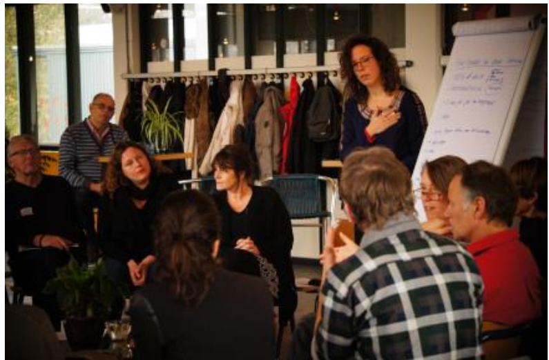
Energiecoaches met elkaar in gesprek