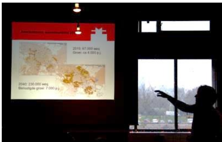
Bram van Beek legt uit wat de gemeentelijke plannen met stadswarmte zijn