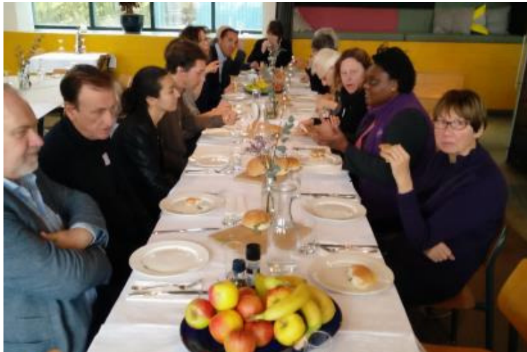
Energiecoaches aan de lunch na afloop van de expertmeeting