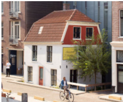
Het Polderhuis in de Rustenburgerstraat

Een tweede excursiegroep ging naar het GroenGemaal , waarin de BuurtEnergieWinkel van Wijksteunpunt Wonen Zuid gevestigd is. Dit pandje in het Sarphatipark is met duurzame materialen opgeknapt en geeft bezoekers een indruk van de mogelijkheden om in de woning energie te besparen. Zo kan vrij eenvoudig warmte binnen- en geluid buiten- gehouden worden door voorzetramen te plaatsen. Op het Gerard Douplein is dit bij meerdere woningen gedaan.