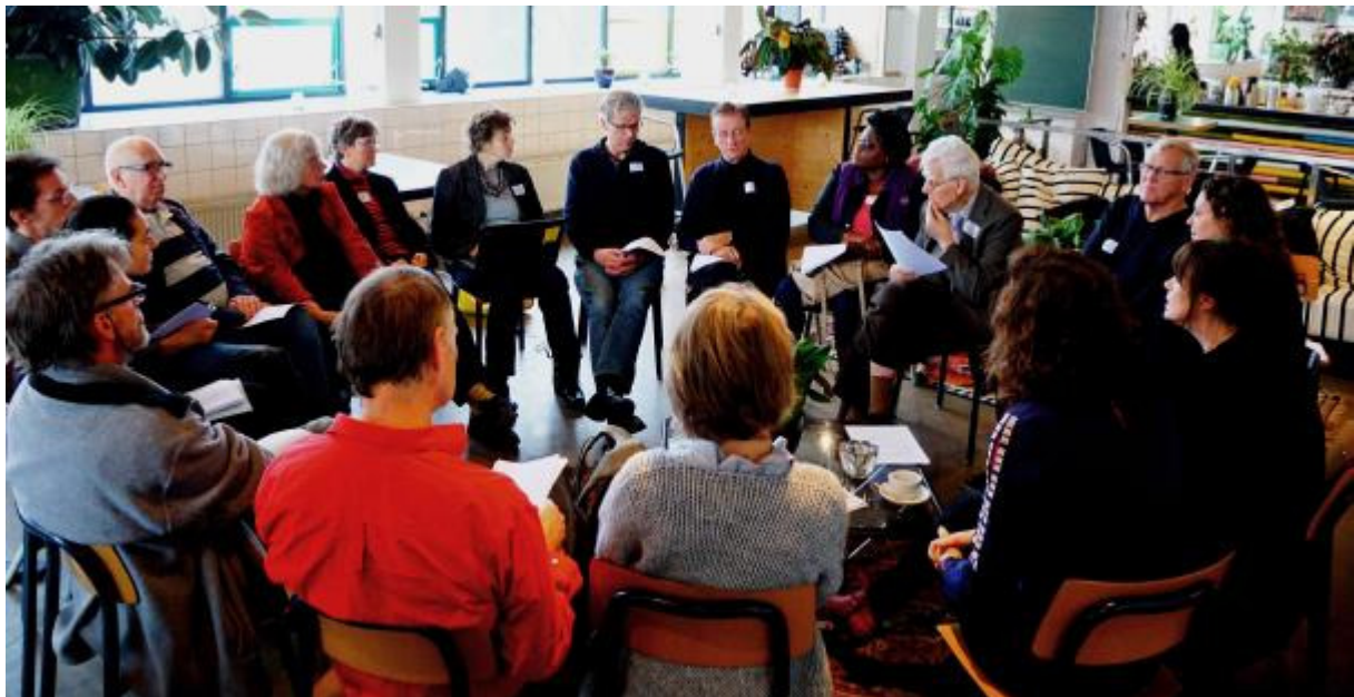
Coaches en professionals met elkaar in gesprek

De dag begon met de Expertmeeting Energiecoaches, vrijwilligers die zijn opgeleid om in hun buurt, complex en omgeving voorlichting te geven over energieverbruik in huis. Negen Amsterdamse Energiecoaches gingen in gesprek met acht professionals die in hun werk de coaches trainen of begeleiden, of onderzoek doen naar de effecten van de inzet.