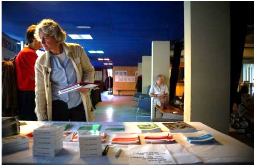
Veel informatie bij de Wijksteunpunt Wonen stand