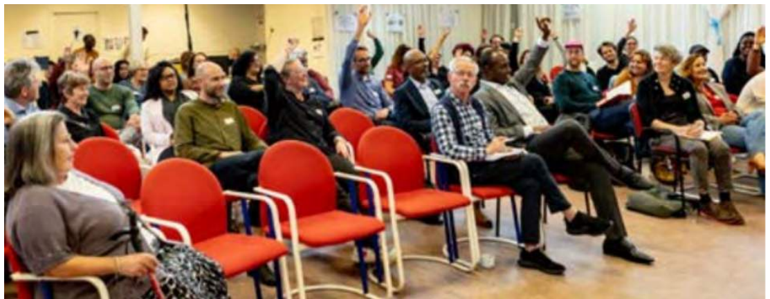
Bijeenkomst buurtplatform in Zuidoost.

In 2023 deden we dit in Nieuw-West (De Punt, Couperusbuurt, Knijptijzerpanden, Deysselbuurt), Zuidoost (Holendrecht, Venserpolder, G-buurt, Reigersbos, Gein) en Noord (Kleine Wereld, Vogelbuurt-IJplein). In Zuidoost ondersteunden we ook bewoners in diverse buurten bij het organiseren van de buurtbudgetten.