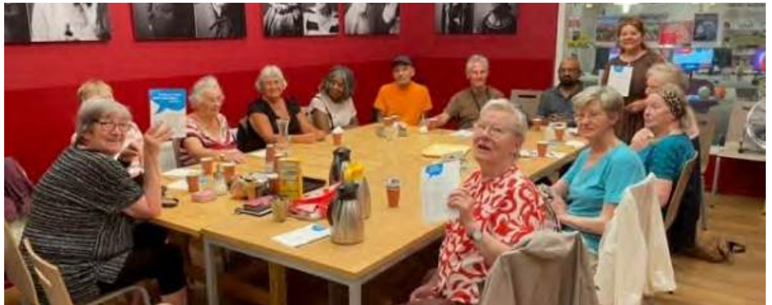
Informatiebijeenkomst bij buurtorganisatie.

Bewoners die een wooncoach aanvragen zijn merendeels 70+. Sommigen hebben de mogelijkheid om snel passende huisvesting te vinden of kunnen de eigen woning passend maken. Een steeds groter wordende groep heeft die mogelijkheid evenwel niet. Deze groep zien we ook steeds vaker op onze spreekuren 'Woning zoeken'. Zij komen pas naar het spreekuur als hun woonsituatie feitelijk niet meer veilig is. We willen ons komend jaar daarom meer richten op het vroegtijdig informeren en activeren van 65-plussers.