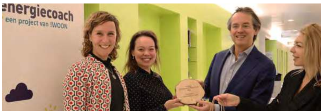
Energiecoachteam neemt onderscheiding in ontvangst.

In het najaar werd het energiecoachteam voor hun werk bekroond met de Zuidas Duurzaamheidsprijs 2023 . Een mooie onderscheiding voor hun inzet.