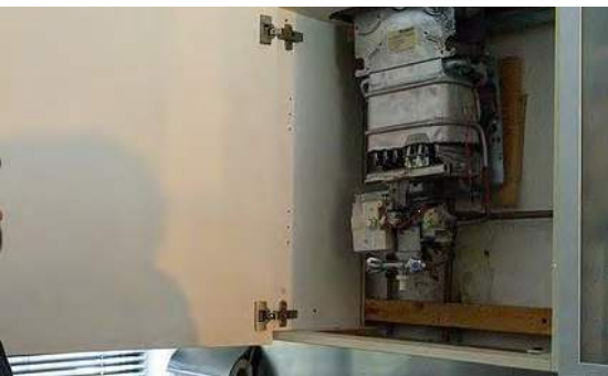
Open geiser in een huurwoning.

Het aantal vragen over schimmel in de woning groeit sinds een aantal jaar. In 2023 hadden we hierover 7.024 contacten, een stijging van 37% t.o.v. vorig jaar. De corporaties ontwikkelden in 2023 een gezamenlijke vocht- en schimmelaanpak. !WOON dacht mee als ervaringsdeskundige. Ook ontwikkelden we in aanvulling op deze reactieve aanpak een pilot voor een proactieve, complexgewijze aanpak met bewonersprofessionals. Het is in 2023 nog niet gelukt hier daadwerkelijk mee te starten.