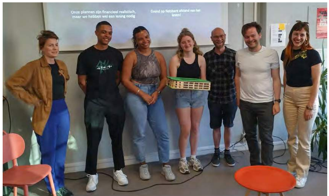
Jongerenpanel Het Nest.

Gedurende het jaar ondersteunden we een groep jongeren die in het kader van het jongerenpanel van IWOON aan de slag gingen met een wooncoöperatie voor jongeren . Een actieve groep van 12 jongeren heeft een plan opgesteld en gepresenteerd aan externe professionals voor wooncoöperatie Het Nest .