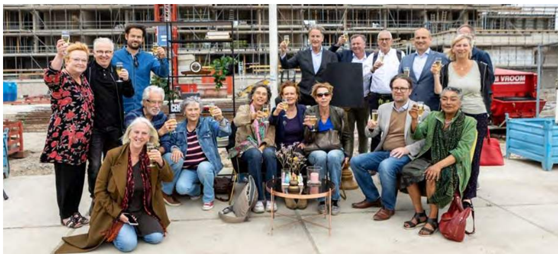
Kerngroep bewoners Stadsveteraan.

We ondersteunden woningcorporatie Woonzorg bij het opzetten van een beheercoöperatie voor het project Stadsveteraan. Een uniek woonconcept voor ouderen die in de stad willen blijven wonen in een hechte woongemeenschap.